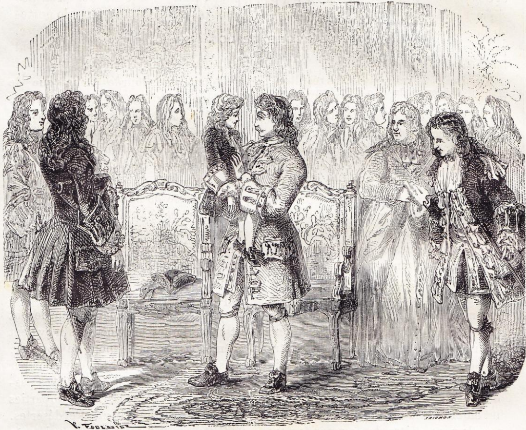
Le czar Pierre le Grand et Louis XV.

fortune qui l'éblouissait par un éclatant repentir ; la duchesse de Montespan, qui régna si longtemps sur la cour, malgré les rivales que le sultan Louis XIV lui donnait si facilement ; mais il nous faudrait aussi parler de la marquise de Maintenon qui, de veuve du cul-de-jatte Scarron, devint la femme de Louis le